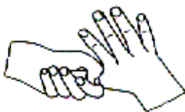
2. 手指交错掌心对手背搓