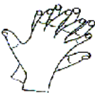
5. 拇指在掌中转动搓擦