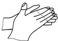
图 D.1 掌心相对，手指并拢相互揉搓