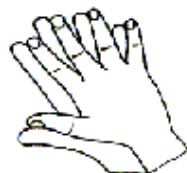
6. 指尖在掌心中搓擦