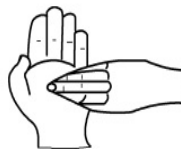
图 D.6 五指并拢,指尖在掌心旋转揉搓