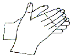
4. 两手互握互搓指背