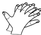
图 D.2 手心对手背沿指缝相互揉搓